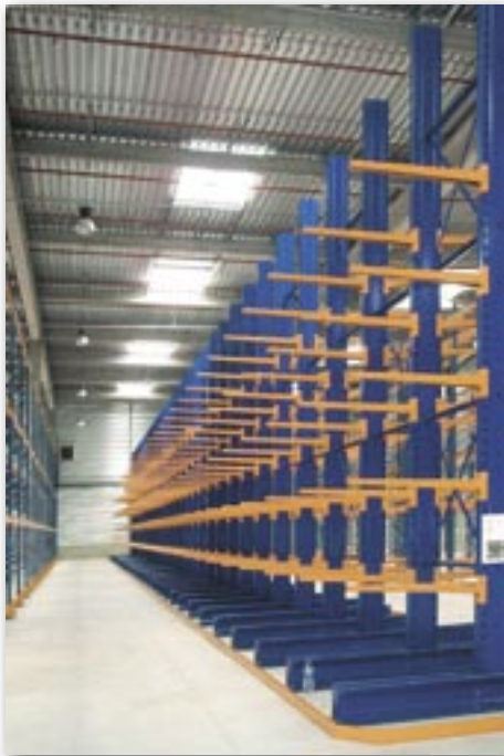
ENTREPÔT - LOGISTIQUE.

LE NÉGOCE DE MATÉRIAUX : rayonnage galvanisé à chaud pour un usage extérieur. (Calcul spécifique en fonction de la région).