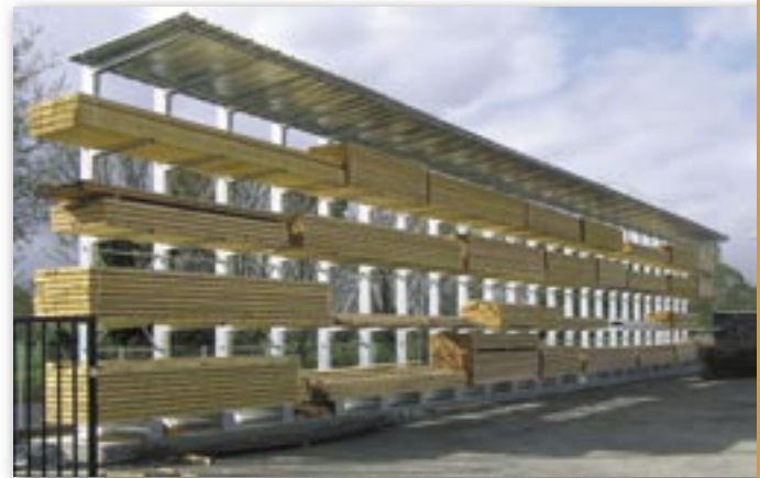
En option : couverture.