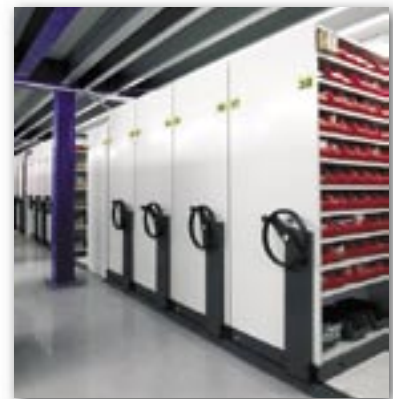
Application avec un rayonnage tôle modulable.