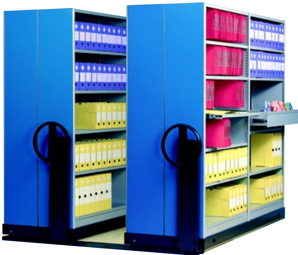
Application avec un rayonnage tôle à parois.