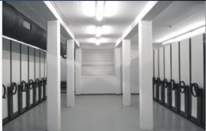
Mécanisme d'entraînement par friction ou à crémaillère.