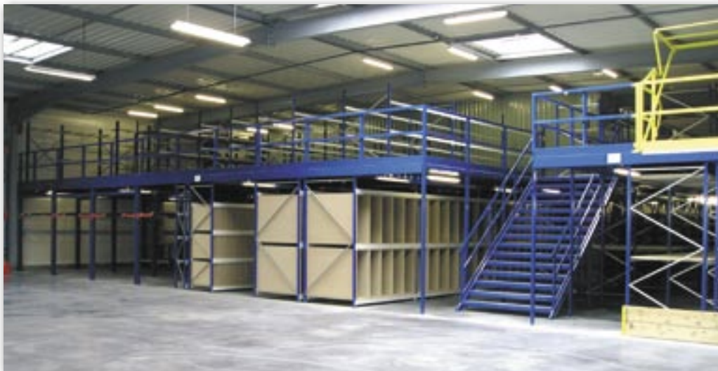
Installation multi étagée.