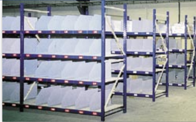
En option : séparations.